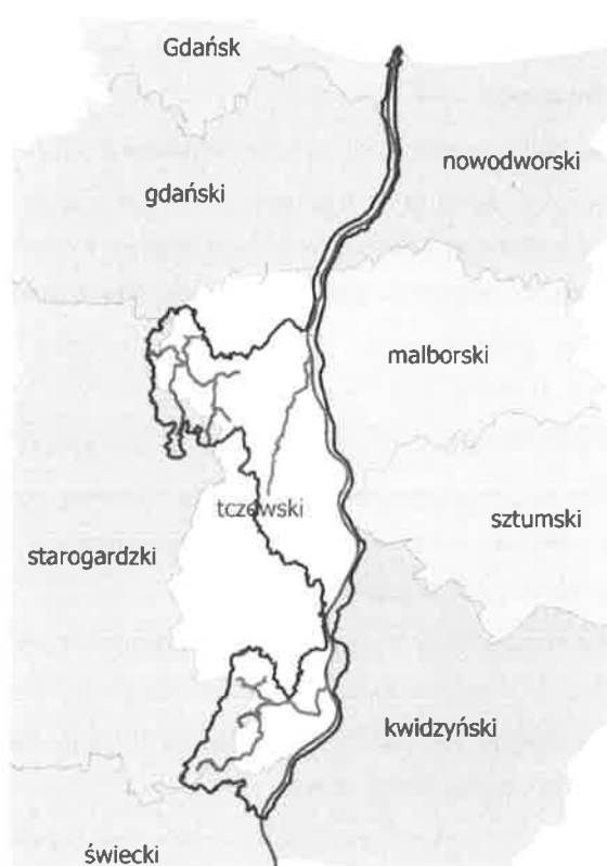
Mapa NW Tczew z naniesionymi głównymi ciekami i granicami powiatów

Długość cieków wynosi 268,50 km, kanałów 52,92 km, wałów p. pow. 116,60 km (w tym wałów przeciwpowodziowych rzeki Wisły 107,10 km), szlaków żeglugowych 89 km, jazy 4 szt., budowle wpustowe i spustowe 5 szt., przepusty z piętrzeniem 10 szt., przepusty wałowe 7 szt., zastawki 1 szt., stopnie korekcyjne 39 szt., na terenie administrowanym przez NW w Tczewie.