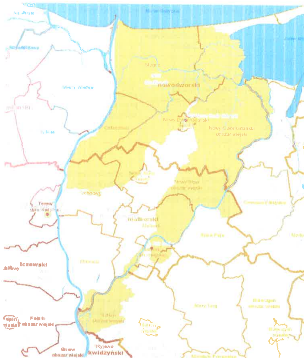
Mapka dot. terenu działalności NW.