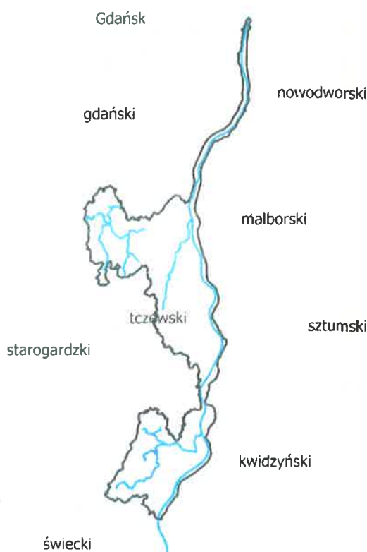
Mapa NW Tczew z naniesionymi głównymi ciekami i granicami powiatów

jazy 5 szt., budowle wpustowe i spustowe 5 szt., przepusty z piętrzeniem 10 szt., przepusty wałowe 7 szt., zastawki 1 szt., stopnie korekcyjne 39 szt.